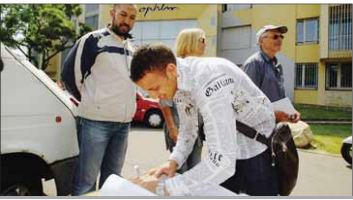
► Les membres du Collectif contre les inégalités et l'exclusion ont reçu tout l'après-midi des habitants de la Rocade.

Un habitant du quartier Saint-Chamand , qui déplore le loyer de son T3 (692 euros). Un autre, des Olivades qui, depuis trois ans, peine à obtenir un appartement plus grand. Un couple de retraités qui voudrait quitter son F5, trop vaste depuis que les enfants ont quitté le nid. Autant de témoignages d'avignonnais, 300 au total, qui noircissent les cahiers du Collectif contre les inégalités et l'exclusion. Il y a quelques jours, ce regroupement d'associations sociales et de mouvements de citoyens a installé son camion blanc devant l'OPHLM de la ville, sur la Rocade.