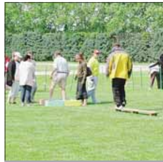
► Ces jeux ont permis de se détendre tout en faisant de nouvelles rencontres.

Une fois par an se déroule sur le stade du centre hospitalier de Montfavet, une journée tout entière consacrée aux jeux moteurs, journée à laquelle près de 250 personnes (200 patients et 50 éducateurs et soignants) participent, appartenant à différentes structures comme le foyer occupationnel de l'Épi du CH Montfavet, Saint-Martin de Carpentras, Uchaux/Orange, les